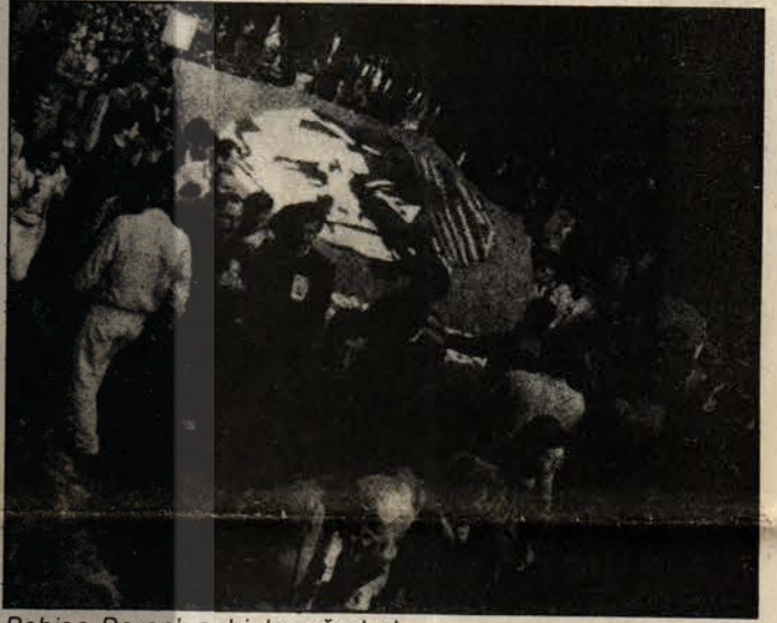
Behice Boran'ı onbinler uğurladı...