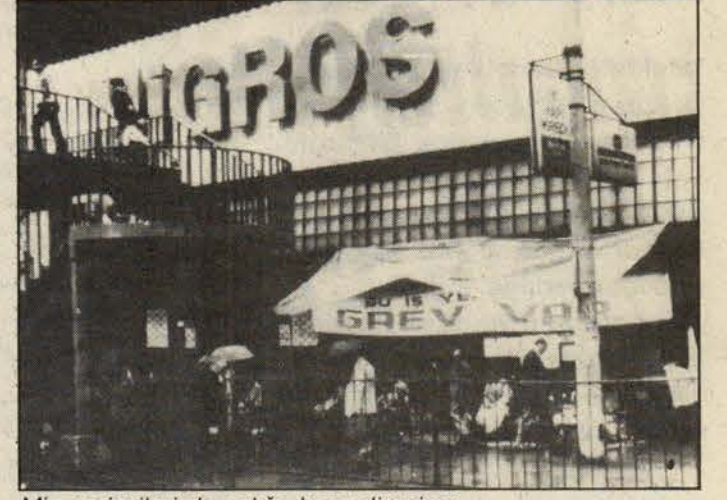
Migros işçileri de açlığa karşı direniyor

Diğer birçok grevden de aynı yönde örnekler vermek mümkündür. Görülmektedir ki, her grev sadece tekil bir işverene karşı değil, birbiriyle yakın dayanışma içinde olan işverenler sınıfına, onla-